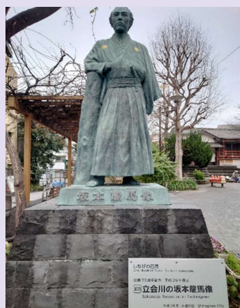
立会川の「20歳の坂本龍馬像」

—江戸時代以前からあった寺社や地形を見ながら、 20歳の坂本龍馬が見た時代を振り返ろう—