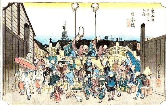
広重「東海道五拾三次之内 日本橋 行列振出」

江戸時代の初期、現在の人形町界隈には、江戸唯一の歓楽街があり、大変な賑わいでした。また中村座や市村座では歌舞伎が上演され、人形浄瑠璃の芝居小屋なども軒を並べ、多くの人形師達がこの町に住んでいたことから、「人形町」という町名がつけました。日本橋人形町から新橋まで歩きます。