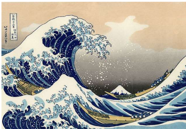
葛飾北斎「神奈川冲浪裏」

江戸時代から、回向院の勸進相撲や隅田川の花火などで江戸随一の賑わいを見せた両国。忠臣蔵ゆかりの吉良邸跡や幕末に活躍した勝海舟生誕の地、世界的に