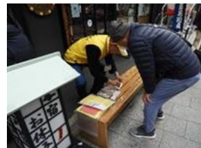
スタンプラリー押印