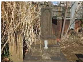
天文学者 渋川春海の墓