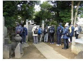
東海寺開山の禅宗の名僧 沢庵和尚の墓