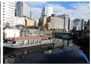
品川浦「御菜肴八ヶ浦」船溜まりは屋形船の乗船場