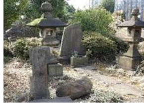
鉄道の父 井上 勝の墓