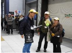
品川宿例会実行委員長