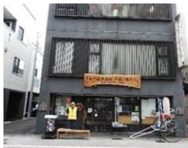
休憩は「しながわ宿交流館」