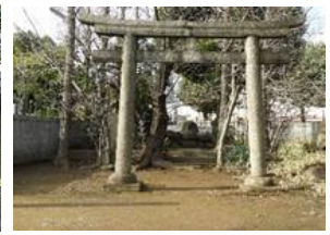
国学者 賀茂真淵の墓