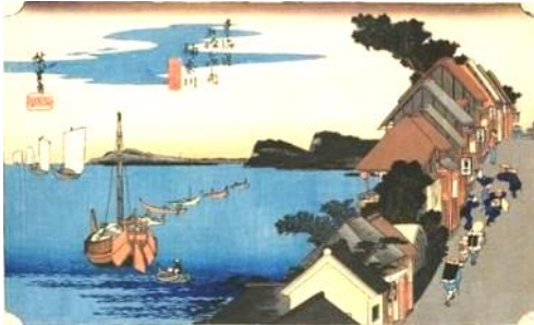
広重「東海道五拾三次之内 神奈川 臺之景」

麗らかな春の一日、横浜発展のため大活躍した高島嘉右衛門や田中平八、勝海舟、岩瀬忠震等の日本人やヘボン、ハリス等外国人ゆかりの神奈川宿を歩きます。そして外交窓口であった神奈川宿を感じましょう