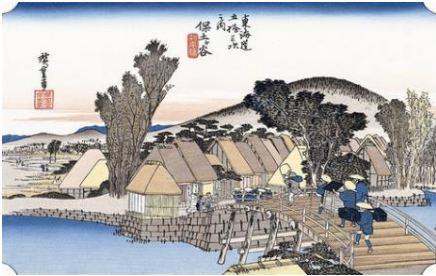
広重「東海道五拾三次之内 保土ヶ谷」