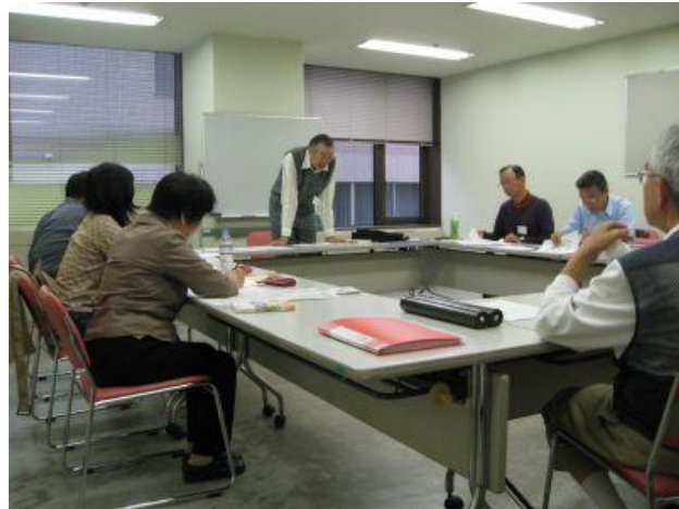
ベテラン講師による熱い講義