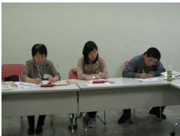
熱心にメモする受講生