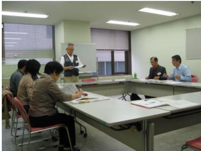
オリエンテーション